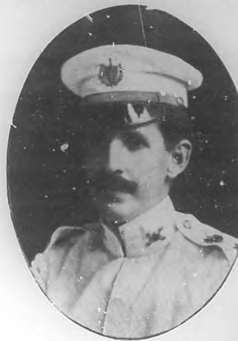
Coronel Luis Moré y del Solar

glés en el Instituto de Pinar del Río, demostrando así cuan va. as son